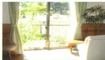
■屋内テラスでのんびり