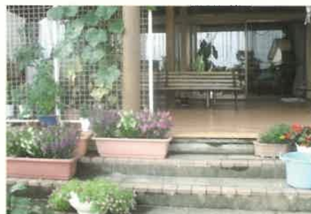
■2つの棟をつなぐ屋外テラス