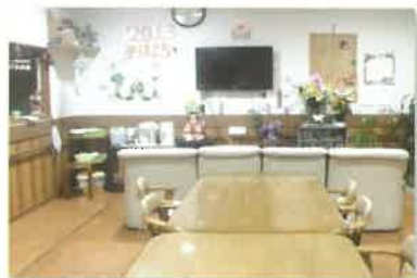
■アットホームな食堂